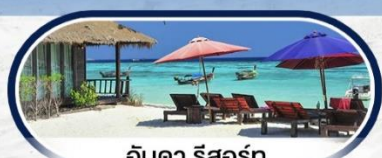
อันดา รีสอร์ท

บินตรง NOK AIR ** บินเข้า-ออก หาดใหญ่ **