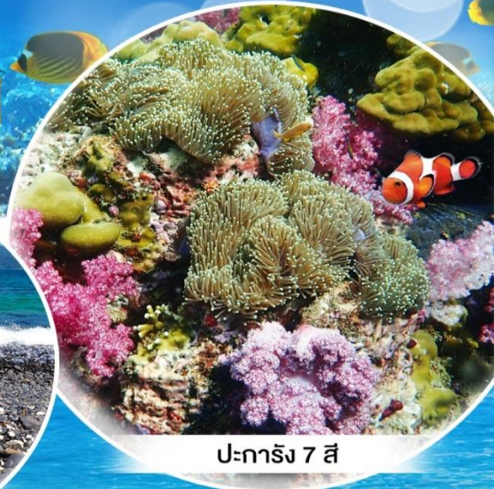
ปะการัง 7 สี