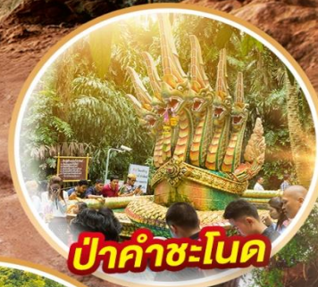
ป่าคำชะโนด