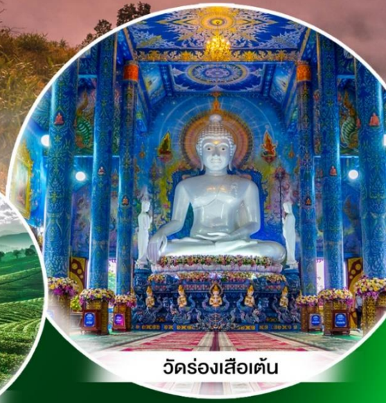
วัดร่องเสือเต้น