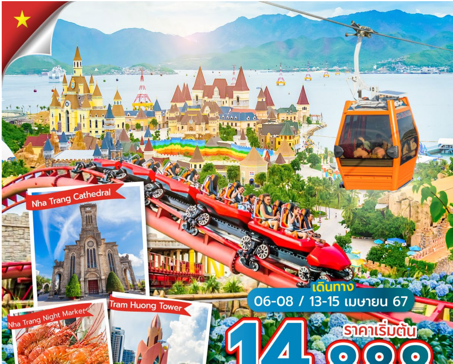
Nha Trang Cathedral