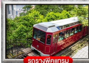
รถรางพิกแครม