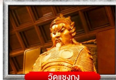
วัดเซ่งก้ง