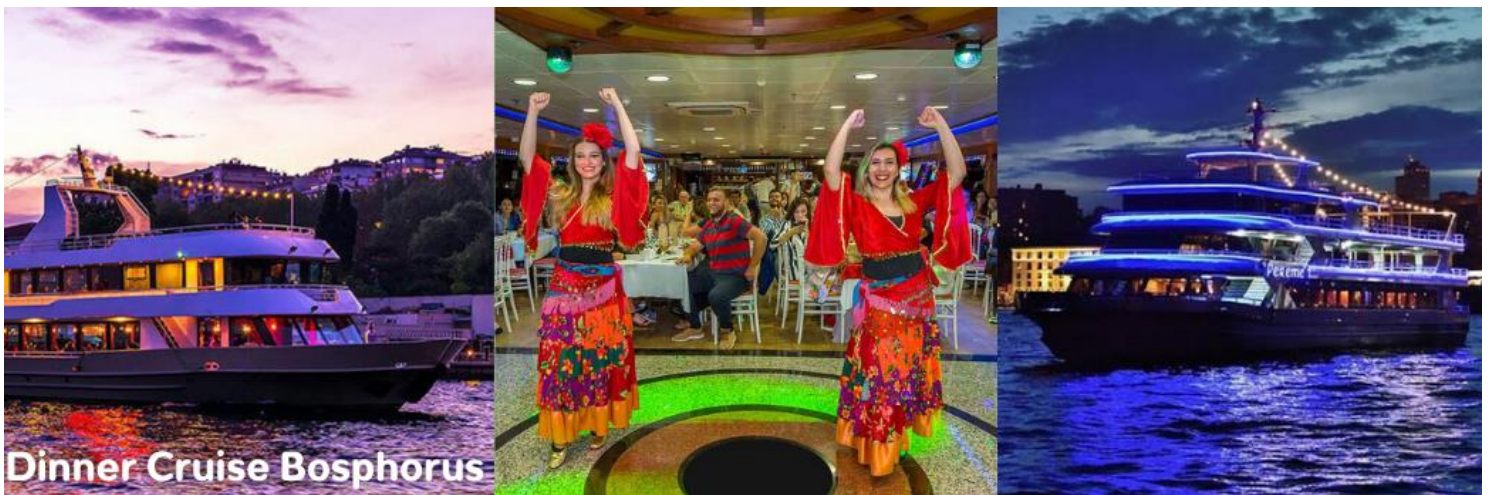
Dinner Cruise Bosphorus