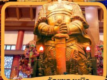
• วัดแซกงหมิว