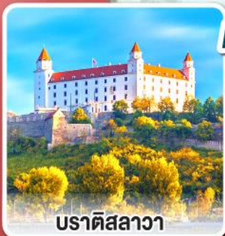
บราติสลาวา

เยือนหมู่บ้านกรีนซิ่ง แห่งออสเตรีย พร้อมอาหารค่ำแบบ “ชอยริเก้”และไวน์สด