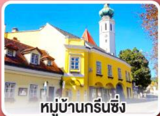
หมู่บ้านกรีนซิ่ง