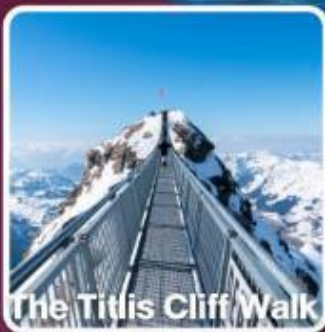
The Titlis Cliff Walk