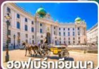
ฮอฟเบิร์กเวียนนา

ตามรอยซีรีส์ Crash Landing on you ที่ทะเลสาบเบรียนซ์