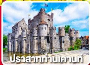
ปราสาทท่านเคานท์