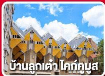
บ้านลูกเต่า โค้กคูมูส