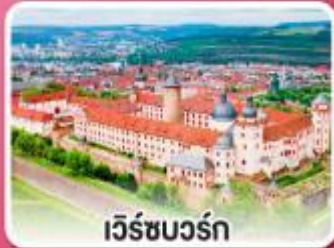
เวิร์ชบวร์ค