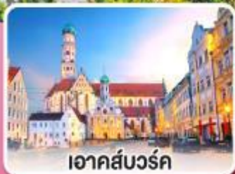
เอาคส์บวร์ค