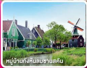
หมู่บ้านกังหันลมชาวนสคิน