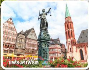
แฟรงก์เฟิร์ต