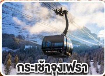
กระเช้าจุงเฟรา