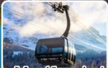
กระเช้า ไอเกอร์เอ็กเพรส สู่อยอดเขาจุงเฟรา

อิตาลี สวิตเซอร์แลนด์ ฝรั่งเศส 10 วัน 7 คืน