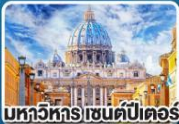
มหาวิหาร เซนต์ปีเตอร์