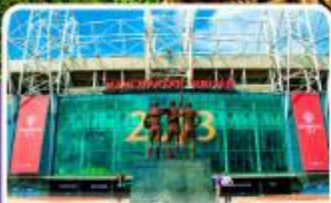
สนามโอลด์แทรฟฟอร์ด