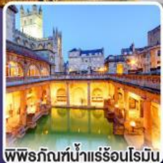
พิพิธภัณฑ์น้ำแร่ร้อนโรมัน

ตื่นตาตื่นใจ กับเสาหินสโตนเฮนจ์ 1 ใน 7 สิ่งมหัศจรรย์ของโลก