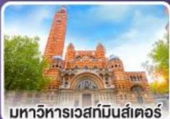
มหาวิหารเวสต์มินสเตอร์