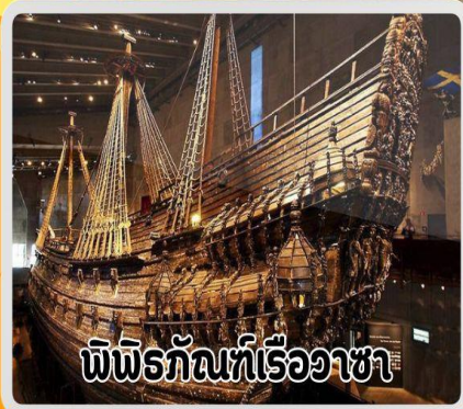
พิพิธภัณฑ์เรือวาซา