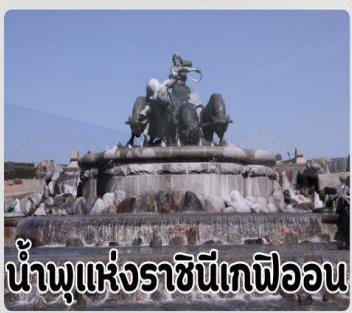
น้ำพุแห่งราชินีเกฟิออน