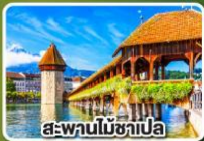
สะพานไม้ซาเปลา