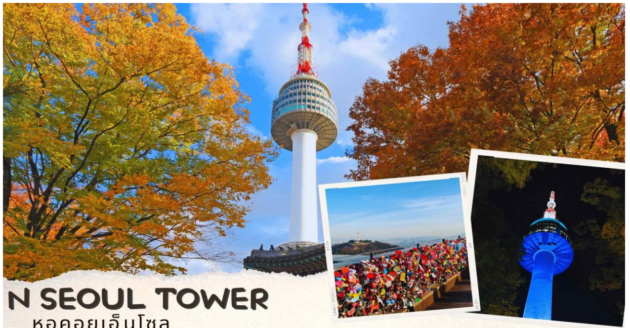
N SEOUL TOWER หอคอยเอ็นโซล

นำท่านเลือกซื้อ สมุนไพรฮอกเกตนามู เป็นผลิตภัณฑ์ผลของฮ็อกเกตนามูที่เติบโตกลางป่าตงดิบกว่า 20 ปี มีสรรพคุณช่วยกรองสารพิษในตับ เหมาะสำหรับคนที่ทำงานหนัก ต้มเหล้า นอนดึก หรือเป็นไวรัสตับอักเสบ ตับแข็ง ให้ท่านอิสระเลือกซื้อให้ตัวเองและฝากครอบครัวหรือญาติผู้ใหญ่ที่ท่านรัก จากนั้นนำท่านไปที่ Seaweed Museum พิพิธภัณฑ์สาหร่ายโซงฮัก เป็นพิพิธภัณฑ์ที่ผลิตและแสดงการเลี้ยงสาหร่ายแบบครบวงจร ซึ่งทางการท่องเที่ยวของประเทศเกาหลีอนุญาตให้นักท่องเที่ยวสามารถเข้าไปเยี่ยมชม และเลือกซื้อสาหร่ายพร้อมทั้งทดลองชิมได้ตามอัธยาศัย นำท่านไปเรียนรู้วิธีการทำ คิมบับ(ข้าวห่อสาหร่าย) อาหารง่าย ๆ ที่คนเกาหลีนิยมรับประทานโดยการนำข้าวสุกและส่วนผสมอื่นๆหลากหลายชนิด เช่น แดงกวา แครอท ผักโขม ไข่เจียว ปูอัด เป็นต้น แล้วแต่วัตถุดิบที่ท่านสะดวก วางแผ่นบนแผ่นสาหร่ายแล้วม้วนเป็นแท่งยาว ๆ จากนั้นหั่นเป็นชิ้นพอดีคำ ชาวเกาหลีนิยมรับประทานคิมบับระหว่างการปิกนิก หรืองานกิจกรรมกลางแจ้ง หรือรับประทานเป็นอาหารกลางวันเบา ๆ โดยเสิร์ฟกับหัวไชเท้าดองและกิมจิ นอกจากนี้คิมบับยังเป็นอาหารนำกลับบ้านที่เป็นที่นิยมทั้งในเกาหลีและต่างประเทศ นำท่านขึ้นภูเขาหนัมซาน เป็นที่ตั้งของ หอคอยเอ็น โซลล์ ทาวเวอร์ (N SEOUL TOWER)