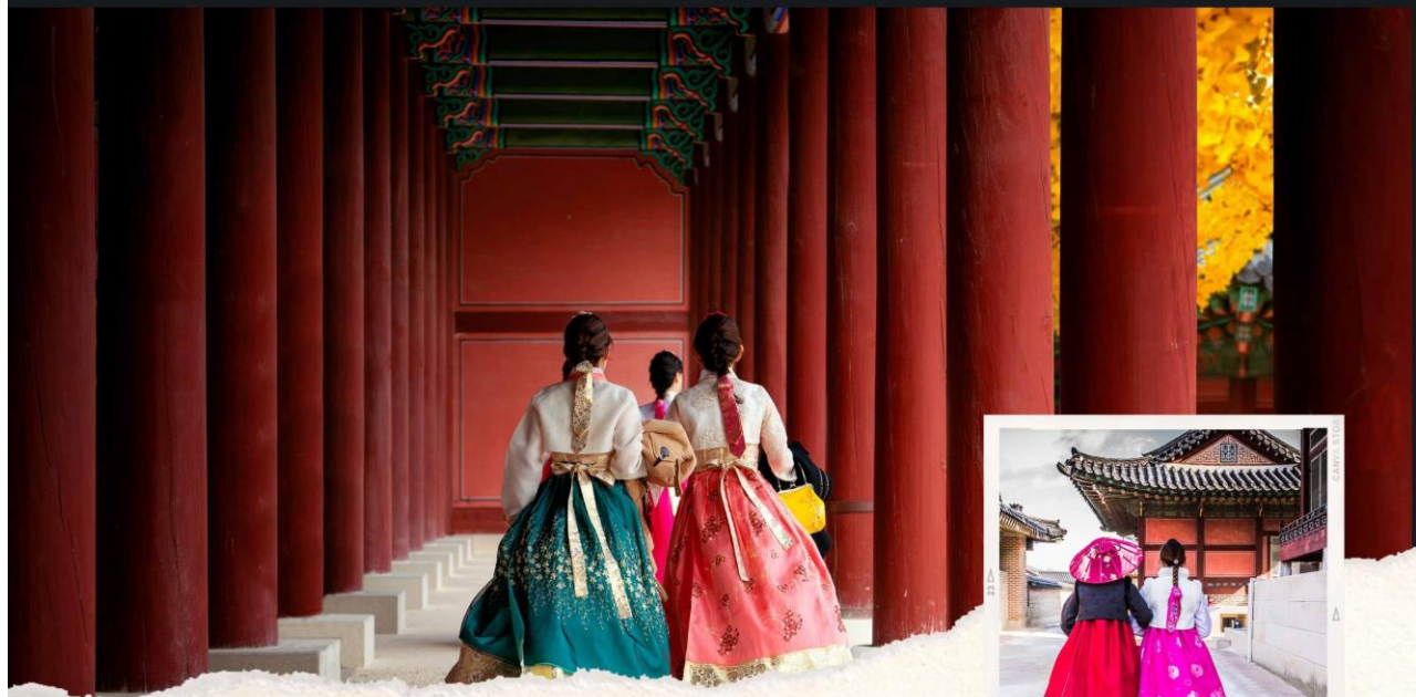
BUKCHON HANOK VILLAGE