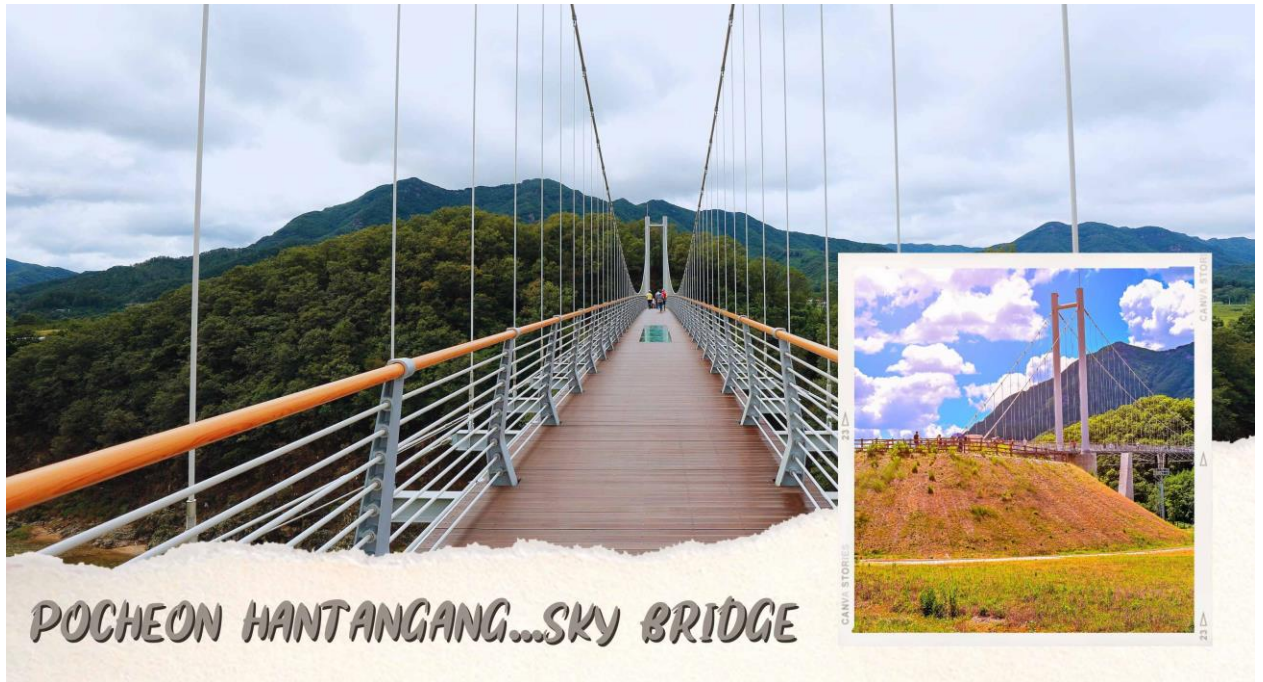
POCHEON HANTANGANG...SKY BRIDGE

เที่ยง 10 รับประทานอาหารเย็น ณ ร้านอาหาร (มื้อที่ 1) ชาบูชาบู สุกี้สไตส์เกาหลีบนหม้อไฟร้อน ๆ ประกอบด้วย หมูสไลด์และผักสดนานาชนิด เสิร์ฟพร้อมน้ำซุปร้อน ๆ