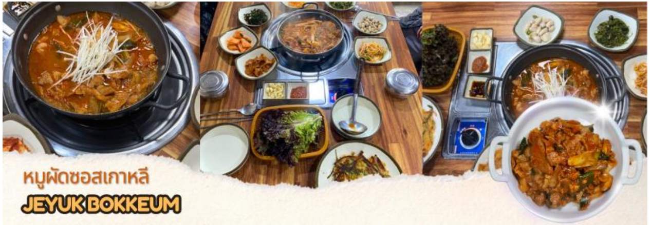
หมูผัดขอสเกาหลี JEYUK BOKKEUM