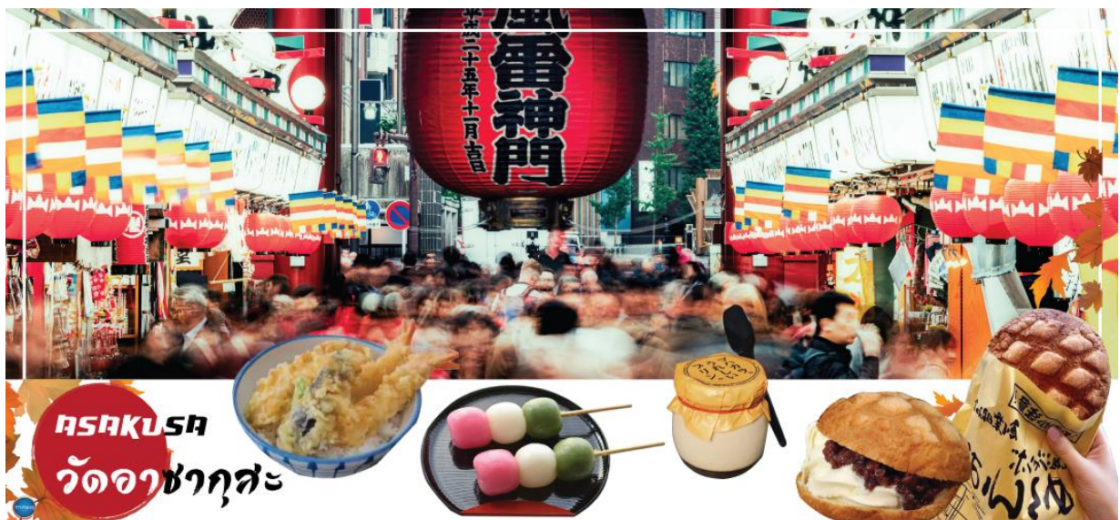
ASAKUSA วัดอาซากุสะ