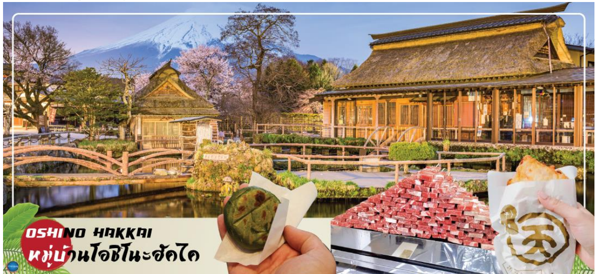
OSHINO HAKKAI หมู่บ้านโอชิโนะฮัคไค

นำท่านเข้าสู่ที่พัก (ใช้เวลาเดินทางประมาณ 20 นาที)