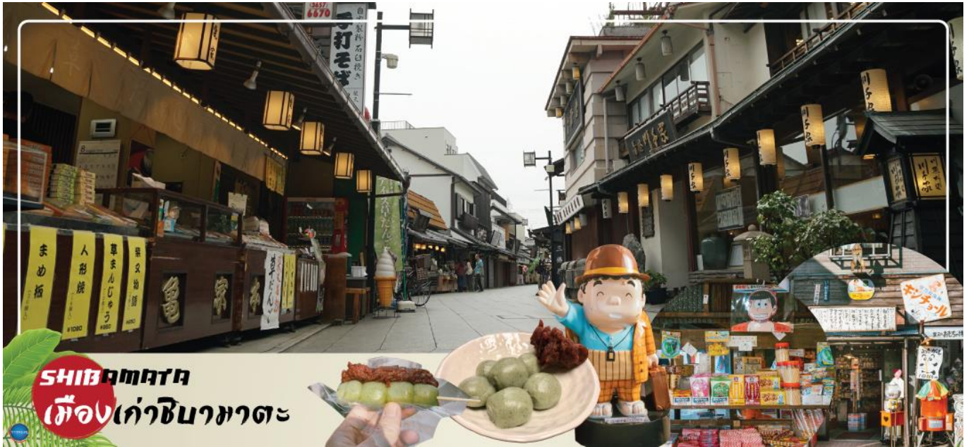
SHIBAMATA เมืองเก่าชิบามาตะ

เมืองนาริตะ – ย่านเมืองเก่าชิบามาตะ – กรุงโตเกียว – วัดอาซากุสะ – ช้อปปิ้งถนนนากามิ สะ – ถ่ายรูปโตเกียวสกายทรีริมแม่น้ำสุมิดะ – ชมแมวยักษ์ 3 มิติ พร้อมช้อปปิ้ง ย่านชินจูกุ – เมืองนาริตะ