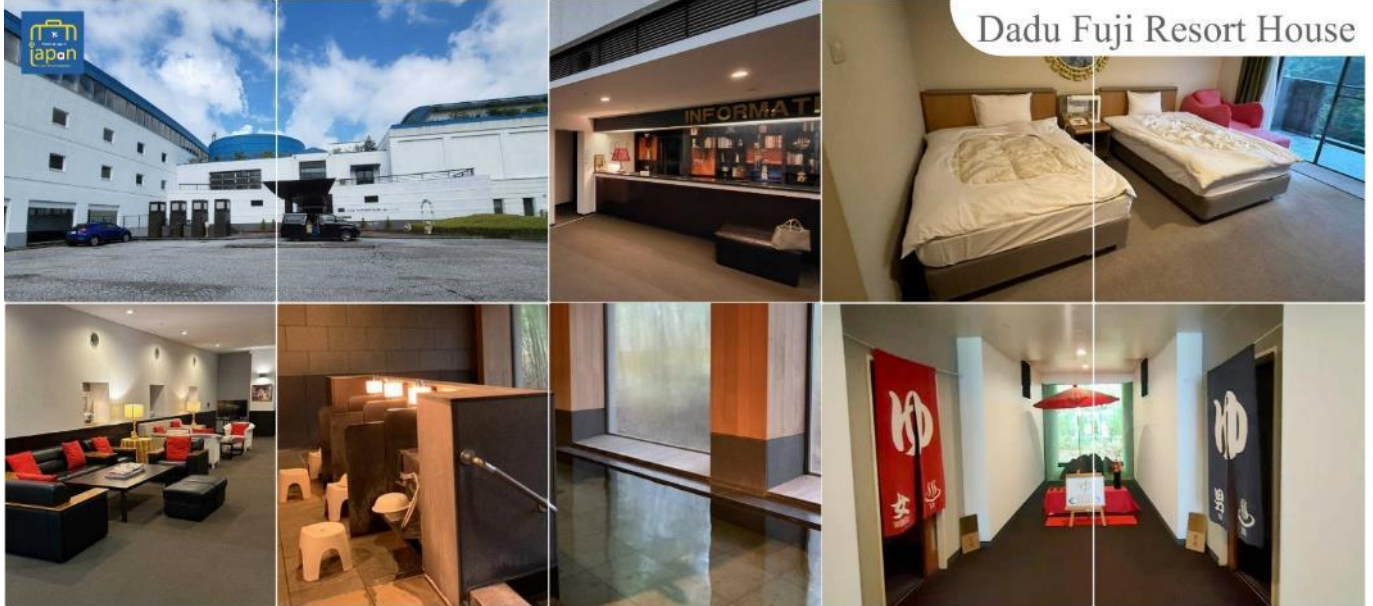
Dadu Fuji Resort House

หลังอาหารให้ท่านได้ผ่อนคลายกับการแช่น้ำแร่ธรรมชาติ เชื่อว่าถ้าได้แช่น้ำแร่แล้ว จะทำให้ผิวพรรณสวยงามและช่วยให้ระบบหมุนเวียนโลหิตดีขึ้น