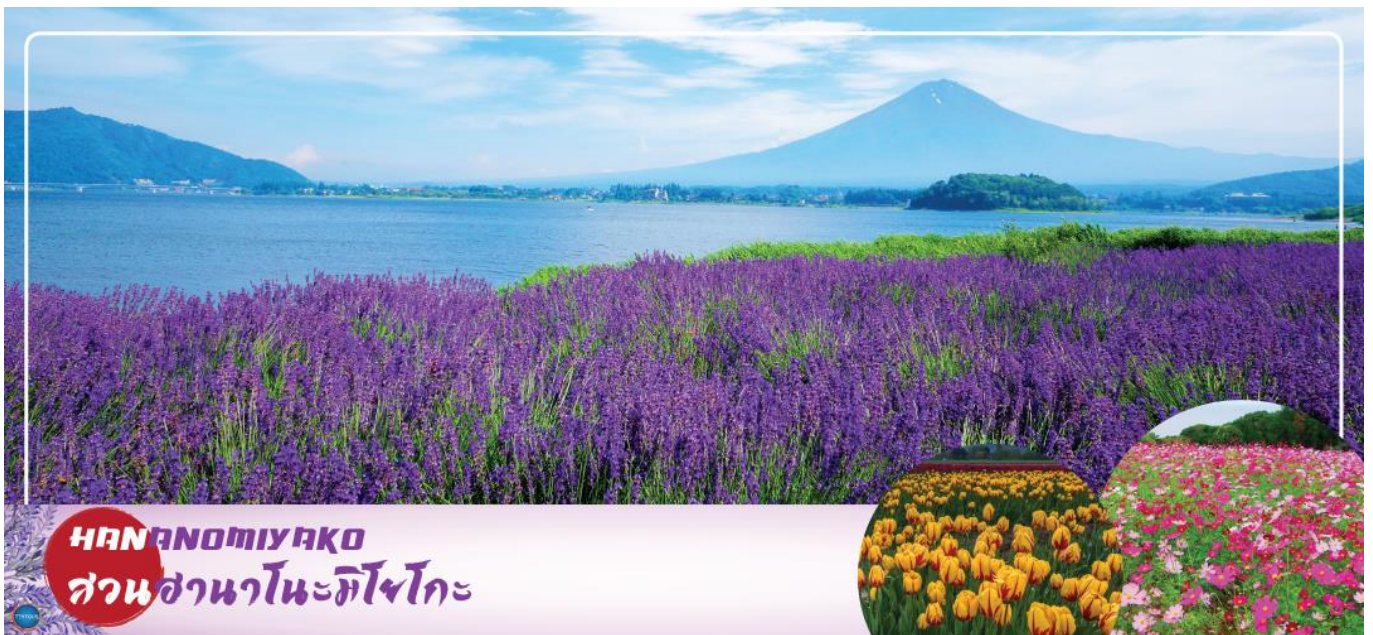
HANANOMIYAKO สวนसानะโนะมิยะโกะ

เมืองยามานาชิ – สวนดอกไม้सानะโนะมียาโกะ หรือ เทศกาลชมดอกลาเวนเดอร์ที่ทะเลสาบคาวากุจิ (ตามฤดูกาล) – พิธีชงชาญี่ปุ่น – กรุงโตเกียว – ย่านโอไดบะ – ห้างไดเวอร์ซิตี – เมืองนาริตะ – อีออนมอลล์ นาริตะ