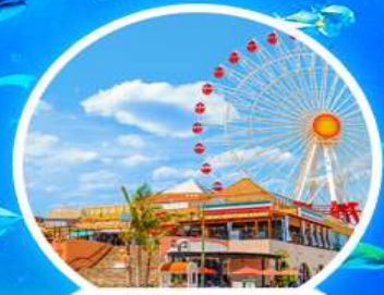
หมู่บ้านอเมริกัน