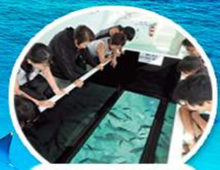
ล่องเรือกระจก