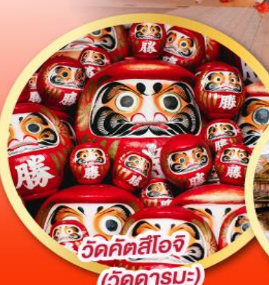
วัดคัตสึโองิ (วัดदारุมะ)