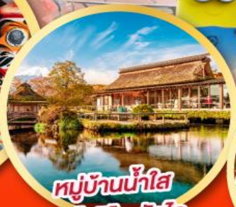
หมู่บ้านน้ำใส โอชิโนะฮักโก