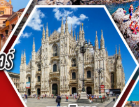
มหาวิหาร ดูโอโมแห่งมิลาน