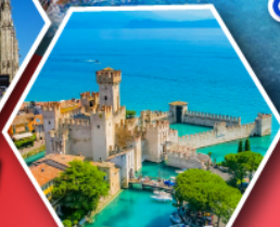
ซิร์มิโอเน่

• อุทยานโดโลไมท์ • นั่งกระเช้าสู่ยอดเขาแอลปี ดิซุสซาเซ • ดินแดนห้าหมู่บ้านชิงเควทอร์เร