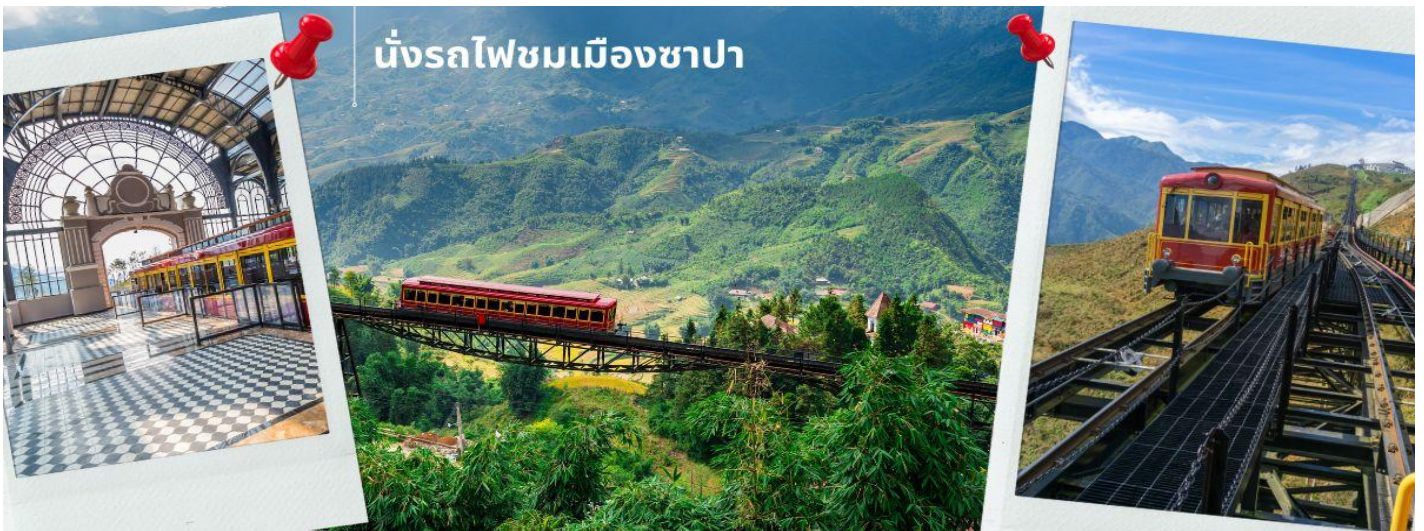
นั่งรถไฟชมเมืองซาปา

นำท่าน นั่งรถไฟชมเมืองซาปา (รวมค่ารถไฟชมเมือง) ท่านจะได้พบกับวิวทิวทัศน์ของเมืองซาปาที่เต็มไปด้วยความสดชื่น และสุดกลั่นอายธรรมชาติ และยังตื่นตาไปด้วยวิวภูเขา และนาขั้นบันได ที่มีชื่อเสียงของเมืองซาปาอีกด้วย ความยาวประมาณ 2 กิโลเมตร โดยใช้เวลาประมาณ 20 นาทีเพื่อไปสู่สถานีขึ้นกระเช้า ที่จะนำท่านขึ้นสู่ยอดเขาฟานซีปัน