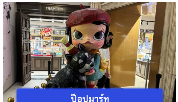
ป๊อปมาร์ท