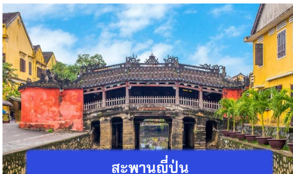
สะพานญี่ปุ่น

จากนั้นนำท่านเดินทางสู่ เมืองโบราณฮอยอัน เมืองมรดกโลกที่ยังคงเอกลักษณ์และรักษาวัฒนธรรมไว้อย่างดีเยี่ยม โดยท่านสามารถเดินเล่น ถ่ายรูป ตามตรอกซอกซอยต่างๆ ได้ ไฮไลท์ของการมาถ่ายรูปเช็คอินที่นี่คือการได้ขึ้นไปถ่ายรูปจากมุมสูงของคาเฟ่ที่อยู่ตามซอกซอย นำท่านชม สะพานญี่ปุ่น สะพานแห่งมิตรไมตรี ที่ได้ชื่อนี้เนื่องจากสะพานแห่งนี้สร้างขึ้นโดยชุมชนชาวญี่ปุ่น เป็นสะพานที่สร้างขึ้นข้ามคลองที่ในอดีต 400 ปีกว่าที่ผ่านมา