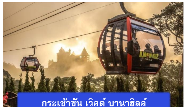
กระเช้าขึ้น เวิลด์ บานาฮิลล์