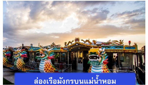
ล่องเรือมังกรบนแม่น้ำหอม

นำท่านเดินทางสู่ เมืองเว้ ราชธานีแห่งอดีต ที่ยังมีลมหายใจ ราชธานีเก่าแก่แห่งราชวงศ์เหงียน เมืองแห่งวัฒนธรรมและความสงบ เว้ยังเป็นศูนย์กลางด้านศิลปะ ดนตรี และอาหารเวียดนามแบบชาวเว้ ที่เรียบง่ายแต่ลุ่มลึก นำท่าน ล่องเรือมังกรบนแม่น้ำหอม เส้นทางแห่งบทกวีและความสงบ นั่งเรือมังกรท่ามกลางสายลมเย็น ชมวิวเมืองเว้ยามเย็นที่สะท้อนเงาอดีตราชธานี ฟังเสียงดนตรีพื้นเมืองลอยแผ่วไปกับสายน้ำ ทุกนาทาคือบทกวีที่ค่อย ๆ เคลื่อนผ่าน