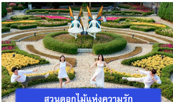
สวนดอกไม้แห่งความรัก

นำท่านชม สวนดอกไม้แห่งความรัก เป็นสวนดอกไม้สไตล์ฝรั่งเศส ที่มีดอกไม้หลากหลายพันธุ์ถูกจัดเป็นสัดส่วนอย่างสวยงามท่ามกลางอากาศที่แสนเย็นสบาย นำท่านชม สักการะพระพุทธรูปหินอึ้ง เป็นพระพุทธรูปหินองค์ใหญ่ตั้งตระหง่านบนยอดเขาแห่งนี้ ให้ท่าน ได้ขอพรเพื่อความเป็นมงคล นำท่านชม ป๊อปมาร์ท เป็นร้านค้าของเล่นเปิดใหม่ล่าสุดที่อยู่บนยอดเขาบานาฮิลล์ มีสินค้าของเล่นสำหรับนักจุ่มมากมายให้ท่านได้เลือกชมกับตัวละครน่ารัก อาทิเช่น Molly, SkullPanda, Labubu หมายเหตุ: การจัดการ และข้อกำหนดในการเข้าชมสินค้าอยู่นอกเหนือการจัดการของบริษัททัวร์ อิสระท่านท่องเที่ยว สวนสนุกแฟนตาซีพาร์ค ซึ่งมีเครื่องเล่นหลากหลายรูปแบบ เช่น ทำท่ายความมันส์ของหนัง 4D ระทึกขวัญกับบ้านผีสิง เกมสนุกๆ เครื่องเล่นเบาๆ รถบั้ง หรือจะเลือกซื้อป๊อปปิ้งของที่ระลึกของสวนสนุก และ จัดรัสแห่งดวงดาว เปรียบเสมือนการเดินทางสู่อาณาจักรแห่งดวงดาวที่มีเส้นทางเชื่อมต่อระหว่างอาณาจักรแห่งดวงจันทร์และอาณาจักรแห่งดวงอาทิตย์ถนนที่แสนงดงาม และสถาปัตยกรรมที่ล้ำสมัยจุดเด่นของที่แห่งนี้ก็คือกระจกใสทรงสามเหลี่ยมที่ดูคล้ายกับพิพิธภัณฑสถานลูฟวร์ที่ฝรั่งเศส ให้ความรู้สึกเหมือนท่านกำลังท่องเที่ยวในโลกแห่งเวทมนต์และดวงดาว (ไม่รวมค่าเข้าชมหุ่นขี้ผึ้งราคาประมาณ 1 แสندอง)