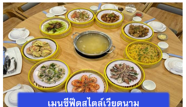
เมนูซีฟู้ดสไตล์เวียดนาม

หลังอาหารกลางวันนำท่านเดินทางสู่ Coffee Palm Beach เป็นร้านกาแฟที่นอกจากท่านสามารถซื้อกาแฟเวียดนามต่างๆชิมได้แล้ว ยังสามารถซื้อเมล็ดกาแฟเป็นของฝากได้อีกด้วย ได้เวลาอันสมควร นำท่านเดินทางกลับสู่ สนามบินดานัง เพื่อเดินทางกลับสู่ประเทศไทย