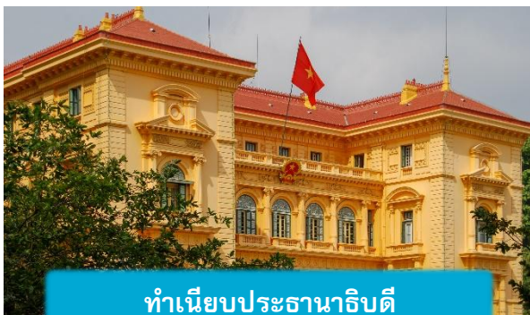
ทำเนียบประธานาธิบดี