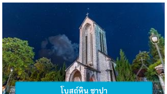
โบสถ์หิน ซาปา