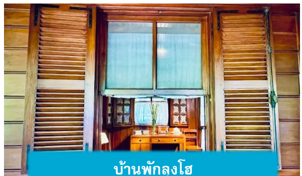
บ้านพักลุงโฮ