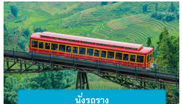
นั่งรถราง

เที่ยง บริการอาหารกลางวัน ณ ภัตตาคาร พิเศษ ... เมนูบุฟเฟ่ฟานซีปัน