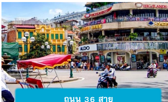
ถนน 36 สาย

21.05 เดินทางถึง สนามบินสุวรรณภูมิ ประเทศไทย โดยสวัสดิภาพ ... พร้อมความประทับใจ