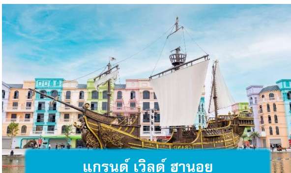
แกรนด์ เวิลด์ ฮานอย

ที่พัก A25 HOTEL ระดับ 4 ดาวมาตรฐานท้องถิ่น หรือเทียบเท่า