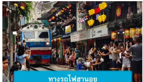
ทางรถไฟฮานอย