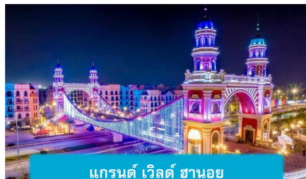
แกรนด์ เวิลด์ ฮานอย