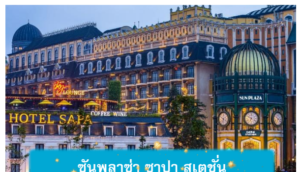
ชั้นพลาซ่า ซาปา สเตชั่น