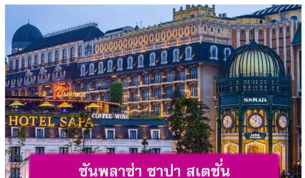
ซันพลาซ่า ซาปา สเตชั่น