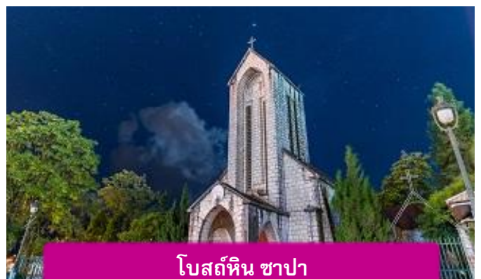
โบสถ์หิน ซาปา