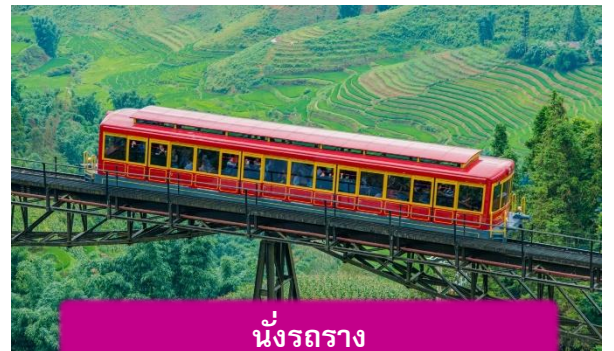
นั่งรถราง

เที่ยง บริการอาหารกลางวัน ณ ภัตตาคาร พิเศษ ... เมนูบุฟเฟ่ฟานซีปัน