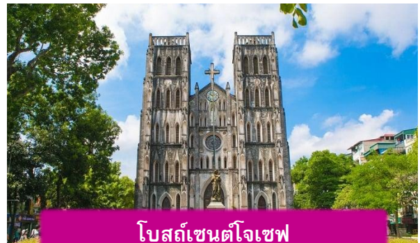
โบสถ์เซนต์โจเซฟ