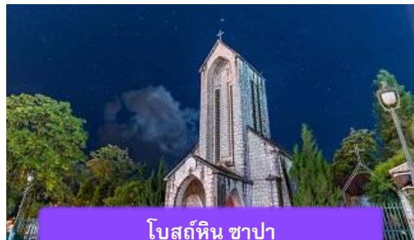
โบสถ์หิน ซาปา