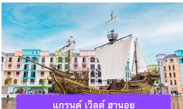
แกรนด์ เวิลด์ ฮานอย