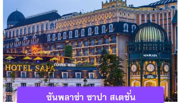
ชั้นพลาซ่า ซาปา สเตชั่น