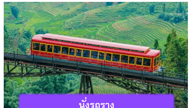
นั้รกราง

นำท่าน นั้กระเช้าไฟฟ้า เพื่อขึ้นสู่ฟานซีปันยอดเขาสูงสุ่แห่งเวียดนามและในภูมิภาคอินโด เป็นกระเช้าไฟฟ้า 3 สายแบบไม่หยุดพัก ขนาดใหญ่จุได้กว่า 30 คน มีความยาวประมาณ 6,200 เมตร หรือ ราว 6 กิโลเมตร