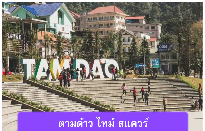
ตามด้าว ไทม์ สแควร์

ที่พัก A25 LUXURY HOTEL ระดับ 4 ดาวมาตรฐาน ท้องถิ่น หรือเทียบเท่า