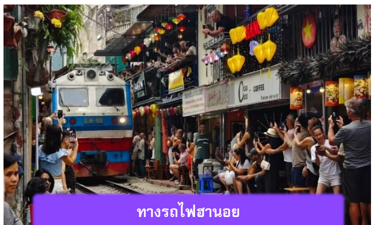
ทางรถไฟฮานอย

นำท่านถ่ายรูปด้านนอก สุสานโฮจิมินห์ จุดเริ่มต้นของการเข้าใจเวียดนาม สถานที่อันเงียบสงบที่สะท้อนจิตวิญญาณของผู้ยิ่งใหญ่ สุสานแห่งนี้ไม่ได้เป็นเพียงอนุสรณ์ แต่คือบทเรียนประวัติศาสตร์ที่สัมผัสได้จริง