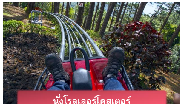
นั่งโรลเลอร์โคสเตอร์