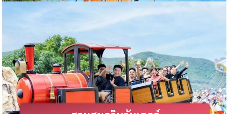
สวนสนุกวินวันเดอร์