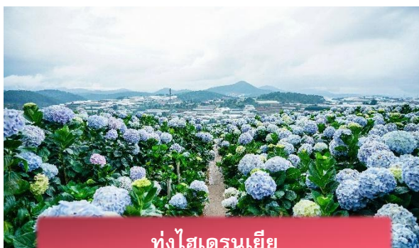
ทุ่งไฮเดรนเยีย

นำท่านเล่น นั่งโรลเลอร์โคสเตอร์ ชมธรรมชาติท่ามกลางป่าสนไปยัง น้ำตกดาตันลา สัมผัสอากาศบริสุทธิ์และบรรยากาศสดชื่น พร้อมจิบเครื่องดื่มชมวิวธรรมชาติ นำท่านเดินทางสู่ ทุ่งไฮเดรนเยีย อีกหนึ่งทุ่งดอกไม้ ที่ไม่ควรพลาดมาถ่ายรูปกัน ข้อดีของที่นี่ คือ ดอกไม้จะบานตลอดทั้งปี