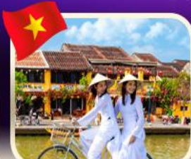
ขี่คอินเมืองท่าฮอยอัน