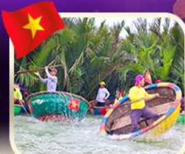
ล่องเรือกระดังกิมทาน