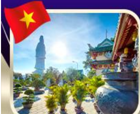
ขอพรกวณิมวัดหลินอึ้ง