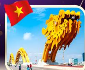
สะพานมังกร ดานัง

บินดอนเมือง แอ่วดานัง นอนบานา คุ่มสุดจึ้ง