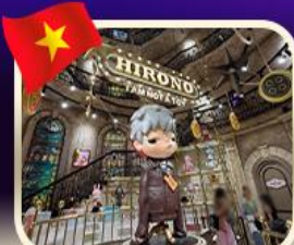
POPMART บานาฮิลล์