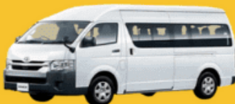
VAN (2-8 ท่าน)