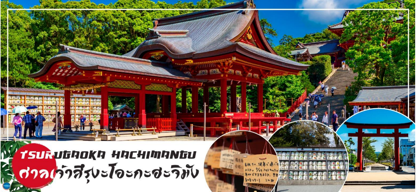
TSURUGAOKA HACHIMANGU ศาลเจ้าสิรุงะโอะกะฮะจิมัง

วันที่สอง ทำอากาศยานนานาชาตินาริตะ – เมืองคามาคุระ – ศาลเจ้าสิรุงะโอะกะ ฮะจิมัง – ถนนโคมาจิโดริ – เกาะเอโนชิมะ – ศาลเจ้าเอโนชิมะ – ถนนเบนไซเท็นนากามิเสะ – เมืองยามานาชิ – ออนเซ็น (-/-/D)