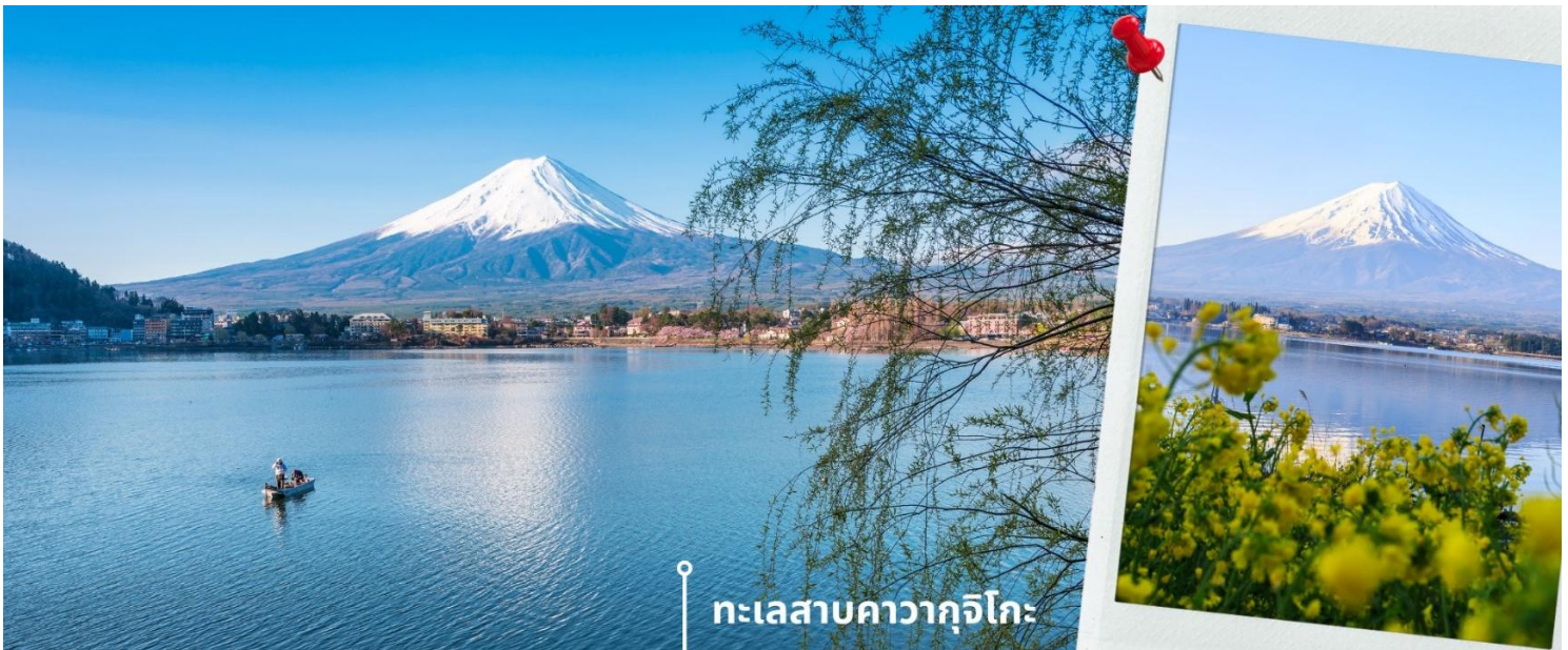
ทะเลสาบคาวากูจิโกะ

หลังรับประทานอาหารเที่ยง นำท่านเดินทางสู่ ทะเลสาบคาวากูจิโกะ (Lake Kawaguchiko) ในจังหวัดยามานาชิ แหล่งท่องเที่ยวที่อยู่ไม่ไกลจากโตเกียว (Tokyo) หนึ่งในที่เที่ยวยอดนิยมตลอดกาล ทะเลสาบที่กว้างใหญ่เป็นอันดับ 2 ของ 5 ทะเลสาบรอบภูเขาไฟฟูจิ อยู่บริเวณเชิงภูเขาไฟ ความสูงกว่าระดับน้ำทะเลประมาณ 800 เมตร ทำให้สภาพอากาศบริเวณนี้เย็นสบายตลอดปี ร่ายล้อมไปด้วยธรรมชาติที่อุดมสมบูรณ์ และทิวทัศน์สวยงามตลอดปี สามารถชมวิวดูได้ทั้งทะเลสาบและภูเขาไฟฟูจิได้อย่างชัดเจนในวันที่ฟ้าเปิด จากนั้นเดินทางต่อไปยัง สวนโออิชิ พาร์ค (Oishi Park) เป็นสวนสาธารณะริมทะเลสาบคาวากูจิโกะ เป็นจุดชมวิวยอดนิยมที่ได้รับความนิยมอย่างมาก เป็นจุดชมดอกไม้ที่ปรับเปลี่ยนไปตามฤดูกาล สายพันธุ์และทัศนียภาพอันสวยงามตัดกับภูเขาไฟฟูจิที่ตั้งตระหง่านอยู่เบื้องหลัง ในวันที่ฟ้าเปิด ยังเป็นจุดชมวิวที่สามารถเห็นวิวภูเขาไฟฟูจิได้ ให้ท่านได้เก็บภาพความสวยงามตามอัธยาศัย