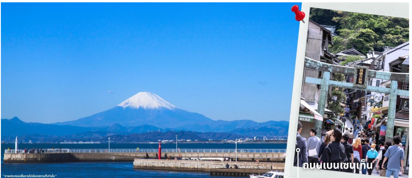
ถนนเบนเซนเท็น

และอิสระเดินเล่นบริเวณ ถนนเบนเซนเท็น นากามิเสะ ซึ่งเป็นถนนคนเดินสายหลักของเกาะ เรียงรายไปด้วยร้านค้า ร้านอาหาร และร้านของฝากท้องถิ่นหลากหลายชนิด ทั้งยังสามารถเลือกชิมอาหารพื้นเมือง เช่น อาหารทะเลสด ขนม และของว่างแบบญี่ปุ่น พร้อมเลือกซื้อของที่ระลึกในบรรยากาศคึกคักแต่ยังคงกลิ่นอายความเป็นท้องถิ่นได้อย่างชัดเจน จากนั้นนำท่านสู่ นิชิอุระพอร์ต จุดชมวิวยามทะเลที่สามารถมองเห็นวิวทะเล ชายหาด พร้อมกันกับในวันที่อากาศดี ท้องฟ้าเปิด ยังสามารถมองเห็นภูเขาไฟฟูจิเป็นฉากหลังได้อย่างสวยงาม เป็นอีกหนึ่งจุดถ่ายภาพที่รวมความงามของวิวภูเขาและทะเลไว้ได้อย่างลงตัว ให้ท่านอิสระถ่ายภาพและชมบรรยากาศตามอัธยาศัย