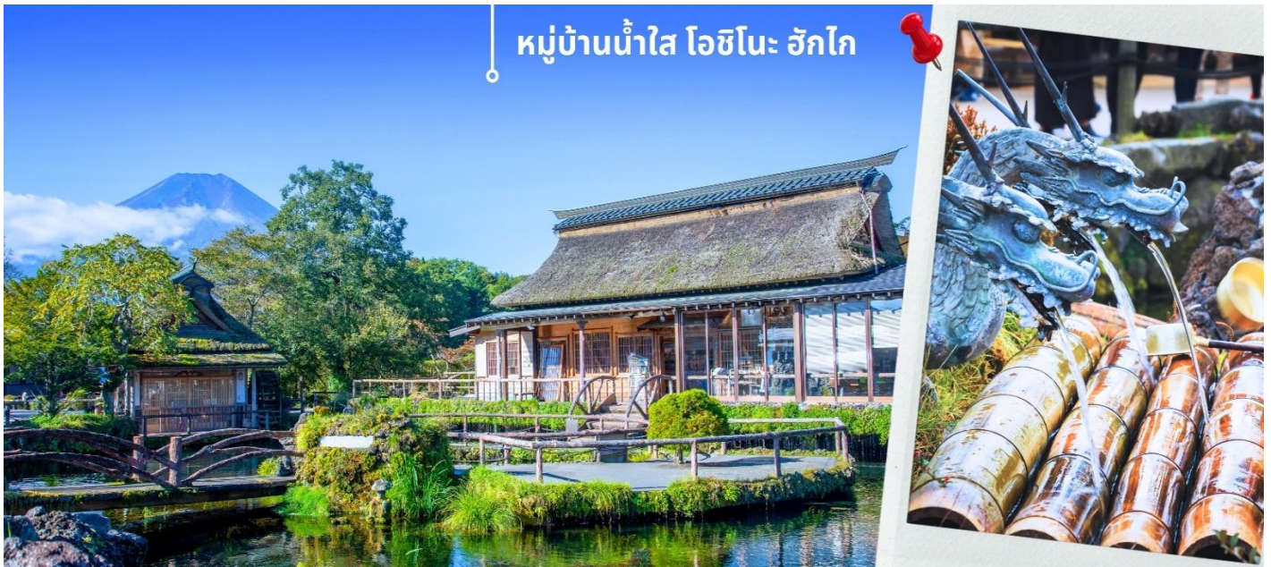
หมู่บ้านน้ำใส โอชิโนะ ฮักไก

หลังรับประทานอาหารเช้า นำท่านเดินทางสู่ หมู่บ้านน้ำใส โอชิโนะ ฮักไก (Oshino hakkai) ถือเป็นหมู่บ้านแห่งการท่องเที่ยวที่ยังคงความอุดมสมบูรณ์ของธรรมชาติเอาไว้ได้อย่างดีในหมู่บ้านมีบ่อน้ำใสที่เป็นน้ำที่ละลายมาจากหิมะบนภูเขาไฟฟูจิ ที่นี้มีความสุขยามในระดับที่ว่าได้รับการขึ้นทะเบียนให้เป็นมรดกทางธรรมชาติ ในปี ค.ศ. 1934 และได้รับคัดเลือกให้เป็นหนึ่งในภูมิทัศน์ทางน้ำที่งดงามในปี ค.ศ. 1985 อีกด้วย ทั้งยังเป็นอีกหนึ่งสถานที่ที่เราสามารถมองเห็นวิวฟูจิ หากวันนั้นเป็นวันที่ฟ้าเปิด