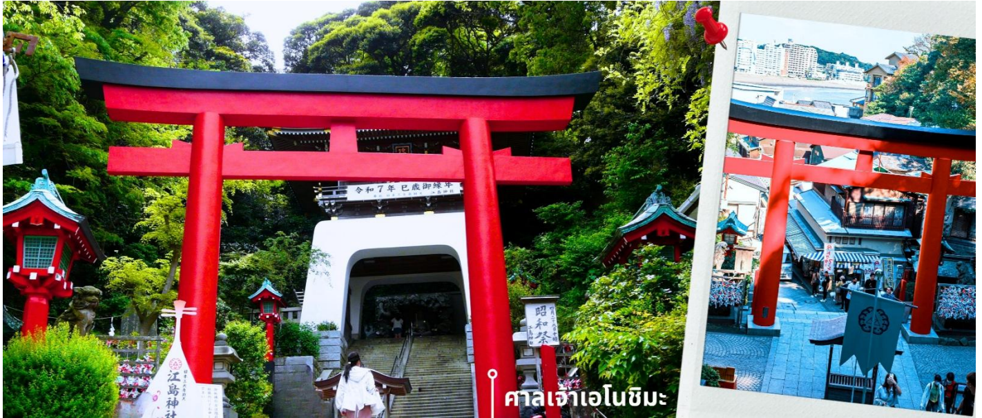
ศาลเจ้าเอโนชิมะ

จากนั้นนำท่านสักการะ ศาลเจ้าเอโนะชิมะ ศาลเจ้าศักดิ์สิทธิ์ที่ตั้งอยู่บนเนินเขาของเกาะ โตเด่นด้วยบันไดทางขึ้นที่ทอดยาวผ่านซุ้มประตูโทริอิและอาคารศาลเจ้าหลายจุดเรียงต่อกัน ภายในประดิษฐานเทพเป็นไซเท็น เทพแห่งโชคลาภ ศิลปะ และความสำเร็จ บรรยากาศโดยรอบเงียบสงบ รายล้อมด้วยธรรมชาติ เหมาะสำหรับการขอพรและสัมผัสวัฒนธรรมญี่ปุ่นแบบดั้งเดิม