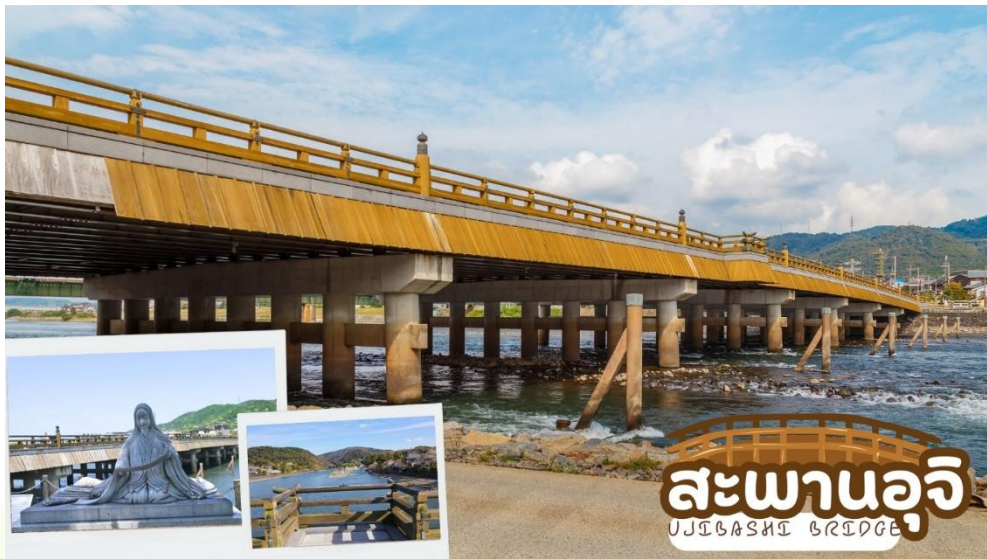
สะพานอุจิ UJIBASHI BRIDGE

ถนนชาเขียว เบียวโดอิน โอมโตะซันโด (Byodoin Omotesando) ตลอดสองข้างทางเต็มไปด้วยร้านขนม ร้านอาหาร และคาเฟ่น่ารักๆ รวมไปถึงร้านของฝาก ที่เกือบทั้งหมดทำมาจากอุจิมัทฉะ ไม่ว่าจะเป็นชอฟูครีมอุจิมัท ฉะ โชบะอุจิมัทฉะ ราเม็งอุจิมัทฉะ เกียวซ่าอุจิมัทฉะ ทาโกะยากิอุจิมัทฉะ และยังมีเมนูอื่นๆอีกมากมายที่น่าลิ้มลอง ตลอดสองข้างทาง ให้ท่านได้แวะชิมรสชาเขียวอุจิมัทฉะต้นตำรับและยังมีขนมที่ทำจากอุจิมัทฉะให้ซื้อกลับไปเป็นของฝาก ด้วย