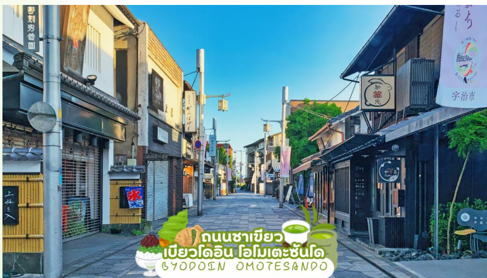
ถนนชาเขียว เบียวโดอิน โอโมเตะซันโด BYODOIN OMOTESANDO

นำท่านชม วัดเบียวโดอิน (Byodoin Temple) เป็นวัดเก่าแก่ที่ได้รับการขึ้นทะเบียนเป็นมรดกโลก Unesco World Heritage สร้างขึ้นตั้งแต่สมัยเฮอันในปี ค.ศ. 1052 จุดเด่นของวัดเบียวโดอินคือ หอโถงฟีนิกซ์ (Phoenix Hall) หรือ วิหารไม้สีแดงสดตั้งอยู่ตรงใจกลางวัด ด้วยความงดงามมาแต่อดีตจนถึงปัจจุบัน วิหารแห่งนี้จึงได้รับเลือกให้ปรากฏอยู่บนเหรียญสิบบเยนของประเทศญี่ปุ่น ด้วยความสวยงามด้านสถาปัตยกรรมที่โดดเด่น มากที่สุดแห่งหนึ่งของญี่ปุ่น ทำให้วัดแห่งนี้ได้รับความนิยมจากนักท่องเที่ยวไม่ขาดสาย