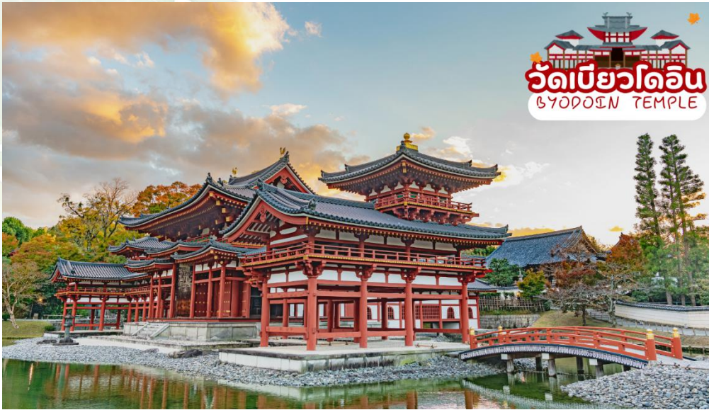
วัดเบียวโดอิน BYODOIN TEMPLE

นำท่านชม วัดเบียวโดอิน (Byodoin Temple) เป็นวัดเก่าแก่ที่ได้รับการขึ้นทะเบียนเป็นมรดกโลก Unesco World Heritage สร้างขึ้นตั้งแต่สมัยเฮอันในปี ค.ศ. 1052 จุดเด่นของวัดเบียวโดอินคือ หอโถงฟีนิกซ์ (Phoenix Hall) หรือ วิหารไม้สีแดงสดตั้งอยู่ตรงใจกลางวัด ด้วยความงดงามมาแต่อดีตจนถึงปัจจุบัน วิหารแห่งนี้จึงได้รับเลือกให้ปรากฏอยู่บนเหรียญสิบบเยนของประเทศญี่ปุ่น ด้วยความสวยงามด้านสถาปัตยกรรมที่โดดเด่น มากที่สุดแห่งหนึ่งของญี่ปุ่น ทำให้วัดแห่งนี้ได้รับความนิยมจากนักท่องเที่ยวไม่ขาดสาย