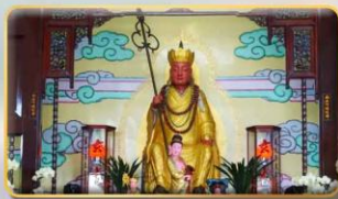
วัดพระกั๊งซำจั้ง