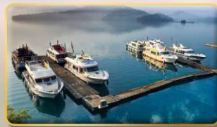
ล่องเรือชมทะเลสาบสุริยันจันทรา