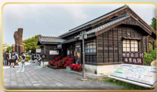
หมู่บ้านฮิน็อกี