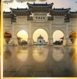
อนุสรณ์เจียงโคเชก