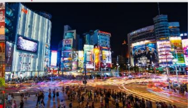
ตลาดกลางคืนซีเหมินติง

*ทางบริษัทฯ ขอสงวนสิทธิ์ในการสลับโปรแกรมทัวร์ตามความเหมาะสมขึ้นอยู่กับสถานการณ์หน้างาน โดยคำนึงถึงผลประโยชน์ของลูกค้าเป็นสำคัญ