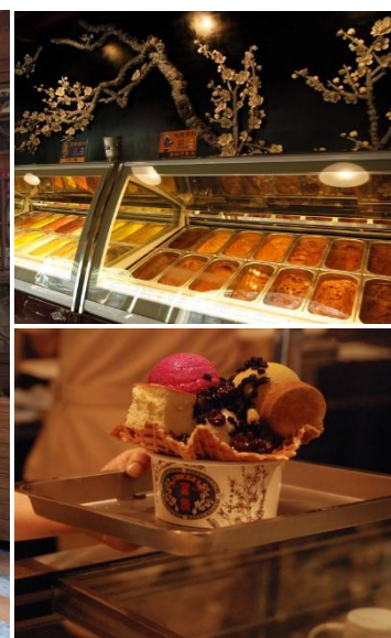
ร้านไอศกรีมมิยาฮาระ (Miyahara Ice cream)