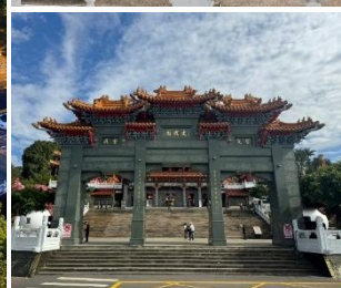
วัดเหวินอู่ (Wenwu Temple)