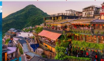
ถนนโบราณจิวเฟิ่น