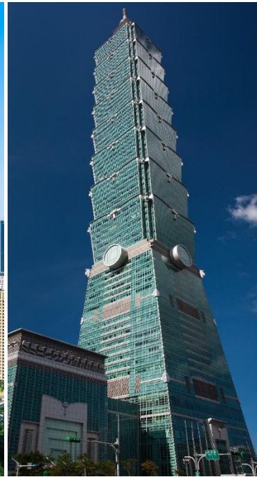
ตึกไทเป 101 (Taipei 101)