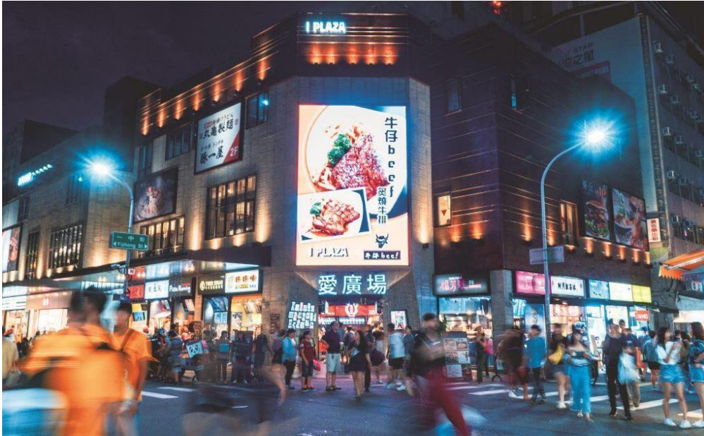
ตลาดกลางคืนอี้จง (Yizhong Street Night Market)

นำท่านเดินทางสู่ ตลาดกลางคืนอี้จง (Yizhong Street Night Market) ที่มีทั้งร้านอาหาร ของกิน ร้านเสื้อผ้า ร้านรองเท้า รวมไปถึงห้างสรรพสินค้า มีแต่ของกินของชื้อที่ได้หัวนเยอะแยะมากมาย ให้ท่านได้เลือกซื้อปเลือกซื้อกันได้ตามอัธยาศัย