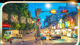
หนิงเซี่ย ไทน์มาร์เก็ต