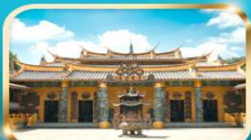
วัดต้าซี ซอความรวย