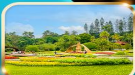
สวนบ้านปรน.เจียงโจเช็ก