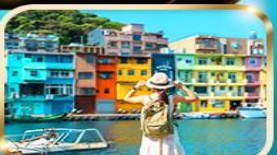
หมู่บ้านประมงเจียงปิง

โปรแกรมเดินทาง 4 วัน 3 คืน : โดยสายการบิน STARLUX AIRLINES (JX)