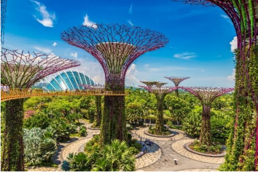
โดยรอบ โดยรอบ (ไม่รวมค่าบัตร SUPERTREE 15 SGD หรือ 405 บาท )

จากนั้นเข้าชม GARDEN BY THE BAY อิสระให้ท่านได้ชมการจัดสวนที่ใหญ่ที่สุดบนเกาะสิงคโปร์ ซึ่งชมกับต้นไม้ขนาดใหญ่ และ เป็นศูนย์กลางการพัฒนาอย่างต่อเนื่องแห่งชาติของ Marina Bay บริหารโดยคณะกรรมการอุทยานแห่งชาติสิงคโปร์ นอกจากนี้ยังมีทางเดินลอยฟ้าเชื่อมต่อกับ Super tree คู่ที่มีความสูงเข้าด้วยกัน มีไว้สำหรับให้ผู้ที่มาเยือนสามารถมองเห็น สวนจากมุมสูงขึ้น 50 เมตร บนยอดของ Super tree สามารถเห็นทัศนียภาพอันงดงามของอ่าวและสวน