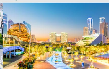
จุดชมวิว City Balcony

*ทางบริษัทฯ ขอสงวนสิทธิ์ในการสลับโปรแกรมทัวร์ตามความเหมาะสมขึ้นอยู่กับสถานการณ์หน้างาน โดยคำนึงถึงผลประโยชน์ของลูกค้าเป็นสำคัญ