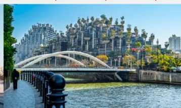
เทียนอันเซียน(อาคารพันต้นไม้)