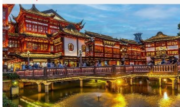
ตลาด 100 ปีเงินหวงเมี่ยว