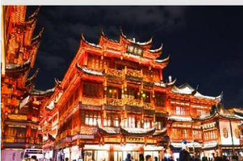
ตลาดร้อยปีเงินหวงเมี่ยว