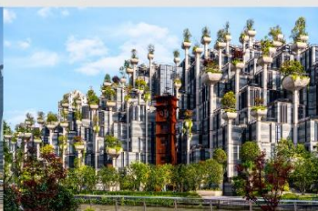
Tian An 1,000 Trees