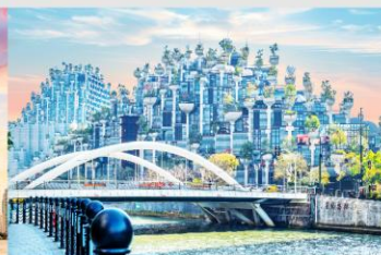
อาคารพันต้นไม้