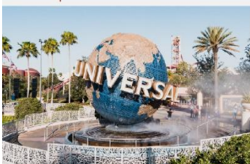
OPTION สวนสนุกยูนิเวอร์ซัล