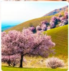
ทุ่งดอกอัลมอนต์