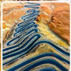
ถนนผานหลงกู่ต้าว