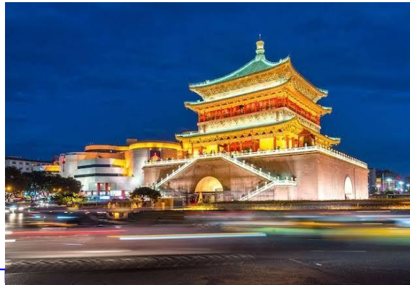
องซีอาน ตั้งอยู่ใจ

กลางเมือง ใกล้กันและสามารถเดินถึงกันได้ หอกลองถูกสร้างขึ้นในสมัยราชวงศ์หมิง เพื่อบอกเวลาและประกาศเหตุการณ์สำคัญ มีความโดดเด่นทางด้านสถาปัตยกรรมเช่นเดียวกับหอรระฆังซีอาน สิ่งที่น่าสนใจคือ โครงสร้างของอาคารไม่ได้มีการใช้ตะปูเหล็กเลย ซึ่งสะท้อนให้เห็นถึงภูมิปัญญาของผู้คนในสมัยก่อนได้เป็นอย่างดี ทั้งสองแห่งมีการแสดงดนตรีและการจัดแสดงเกี่ยวกับประวัติศาสตร์และวัฒนธรรม