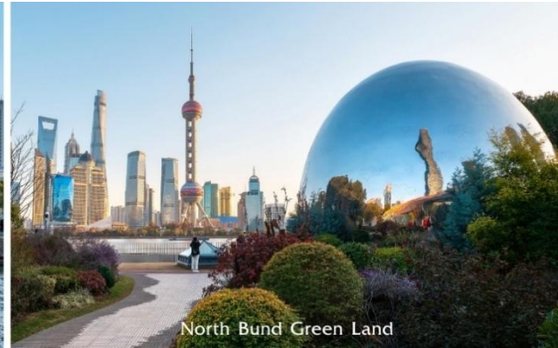
North Bund Green Land

จากนั้นนำท่านสู่ STARBUCKS RESERVE ROASTERY สาขาใหม่ที่นครเซี่ยงไฮ้ มาพร้อมกับความยิ่งใหญ่อลังการของตำแหน่งสตาร์บัคส์ที่ใหญ่และสวยที่สุดในโลก ซึ่งได้ทำการเปิดตัวไปเมื่อวันที่ 6 ธันวาคม 2560 มีเนื้อที่ใหญ่โตถึง 2,787 ตารางเมตร ด้านบนของร้านตกแต่งด้วยแผ่นไม้รูปหกเหลี่ยมซึ่งเป็นงานแฮนด์เมดจำนวน 10,000 แผ่น และที่ตั้งตระหง่านอยู่กลางร้านคือถ้ำกาแฟทองเหลืองขนาด 40 ตัน สูงเท่าตึก 2 ชั้น ประดับประดาด้วยแผ่นตราประทับแบบจีนโบราณมากกว่า 1,000 แผ่น ซึ่งบอกเล่าเรื่องราวความเป็นมาของสตาร์บัคส์ กาแฟที่คั่วในถ้ำทองเหลืองนี้จะถูกส่งผ่านไปตามท่อทองเหลืองด้านบน ซึ่งจะทำให้เกิดเสียงราวกับเสียงดนตรี มีแคนเตอร์ที่ยาวที่สุด ซึ่งมีความยาวถึง 26.9 เมตร