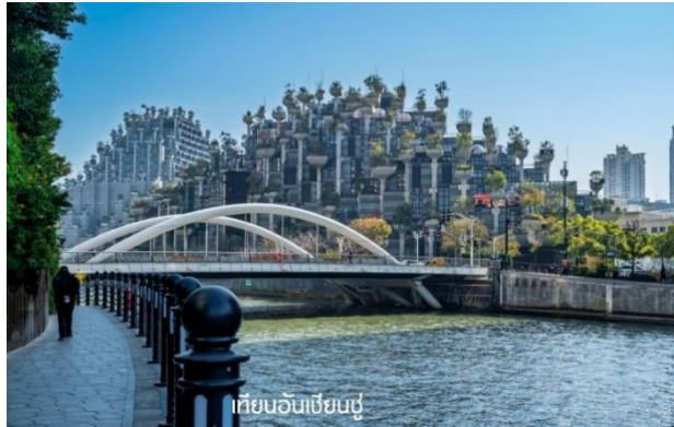
เทียนอันเซียนชู่

นำท่านเดินทางสู่ เทียนอันเซียนชู่ (Tian An 1,000 Trees) หรือเรียกว่า อาคารพันต้นไม้อัจฉริยะที่ประดับตกแต่งด้วยต้นไม้มากกว่า 1,000 ต้น ได้รับการขนานนามว่าเป็นสิ่งมหัศจรรย์ของโลกสมัยใหม่ โดยคาดว่าต้นไม้อันหนึ่งจะสามารถช่วยดูดซับคาร์บอนไดออกไซด์ 21 ตันต่อปี ด้านในของอาคารมีทั้งส่วนของที่พักอาศัย ร้านอาหาร พิพิธภัณฑ์ แกลเลอรีศิลปะ อาหารสำนักงานและห้างสรรพสินค้า