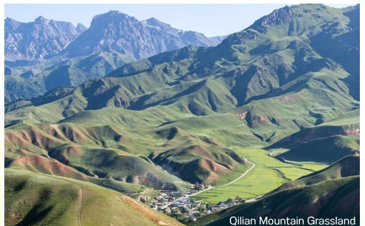
Qilian Mountain Grassland