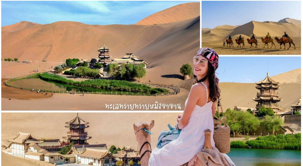
ทะเลทรายทรานมิงซาซาน