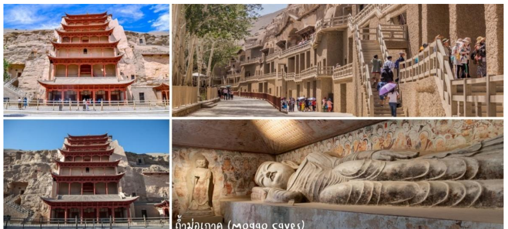
ถ้ำม่อเกา (Mogao caves)

จากนั้นนำท่านชม ถ้ำม่อเกา (Mogao Caves) อยู่บริเวณหน้าผาของเขามิงซาซาน หรือที่รู้จักกันในชื่อ "ถ้ำพระพุทธรูปพันองค์" เป็นหนึ่งในศาสนสถานและแหล่งพุทธศิลป์ที่ยิ่งใหญ่และมีชื่อเสียงที่สุดของจีน ตั้งอยู่ที่เมืองตุนหวง มณฑลกานซู่ ทางตะวันตกเฉียงเหนือของประเทศจีน เริ่มสร้างขึ้นตั้งแต่ศตวรรษที่ 4 (ประมาณปี ค.ศ. 366) และมีการสร้างต่อเนื่องยาวนานกว่า 1,000 ปี ผ่านราชวงศ์ต่างๆ กว่า 10 ราชวงศ์ ภายในถ้ำประกอบด้วยจิตรกรรมฝาผนังเนื้อที่รวมกว่า 45,000 ตารางเมตร และรูปปั้นสีมากกว่า 2,000 องค์ ซึ่งสะท้อนถึงศรัทธาและความประณีตในแต่ละยุคสมัย : เป็นสถานที่ค้นพบ "ถ้ำเก็บพระคัมภีร์" (Library Cave) ซึ่งบรรจุเอกสาร คัมภีร์ และโบราณวัตถุสำคัญกว่า 50,000 รายการ ได้รับการขึ้นทะเบียนเป็นมรดกโลกโดย UNESCO ในปี พ.ศ. 2530 ในฐานะแหล่งรวมพุทธศิลป์ที่สมบูรณ์ที่สุดแห่งหนึ่งของโลก (รวมรถในอุทยาน+ใช้ตัวประเภท B)