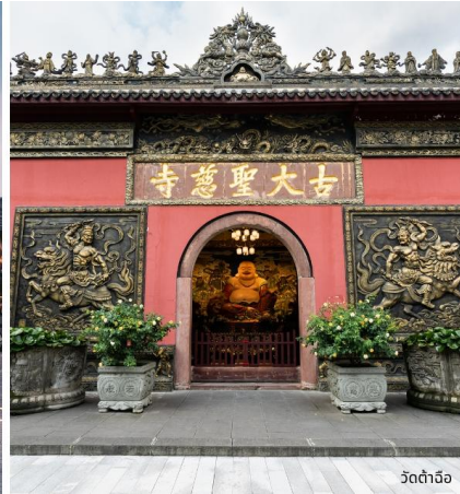
วัดต้าจื่อ

จากนั้นท่านช้อปปิ้งที่ย่าน ถนนคนเดินชุนซีลู่ ซึ่งเป็นย่านวัยรุ่น และขายสินค้าที่ทันสมัย ทั้งสินค้าแบรนด์เนมและเสื้อผ้า รองเท้า กระเป๋า รวมถึงร้านขายของกินมากมาย เป็นถนนที่ปิดไม่ให้รถสามารถวิ่งผ่านได้