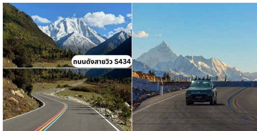
ถนนดงสายวิว S434

จากนั้นนำท่านเดินทางสู่ ถนนดงสายวิว S434 机场路 (เส้น 434 ถนน Airport) หรืออีกชื่อคือถนนสายรุ่ง เป็นเส้นระหว่างคังตั้งไป ซินตูเฉียว (ทางไปHonghaizi และ Yuzixi) เป็นเส้นที่สวยงามและที่นิยมอีกที่หนึ่ง เต็มไปด้วยวิว ภูเขา และวิวธรรมชาติตลอด 2 ฝั่งทาง