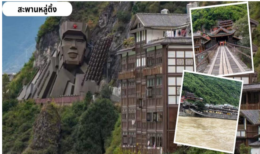
สะพานหลู่ตั้ง

จากนั้นนำท่านเดินทางสู่ ซินตูเฉียว (Xinduqiao) ใช้เวลาเดินทางประมาณ 1 ชั่วโมง ทางตะวันตกเฉียงใต้ของ ประเทศจีน โดยเป็นเมืองเล็กๆ ที่อยู่ในเขตที่ราบสูงทิเบต ที่นี่มีทิวทัศน์ที่สวยงามของทุ่งหญ้า ภูเขา และวัฒนธรรม ทิเบต ทำให้เป็นที่รู้จักในฐานะ "สวรรค์ของช่างภาพ"