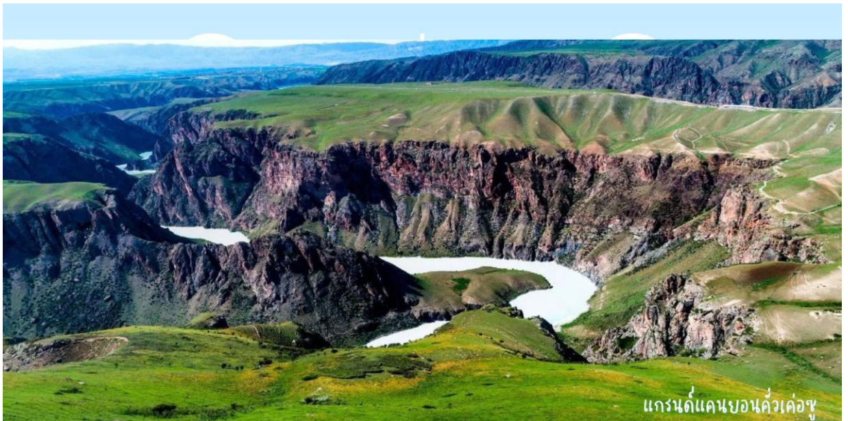
แกรนด์แคนยอนคิ้วเค่อซู