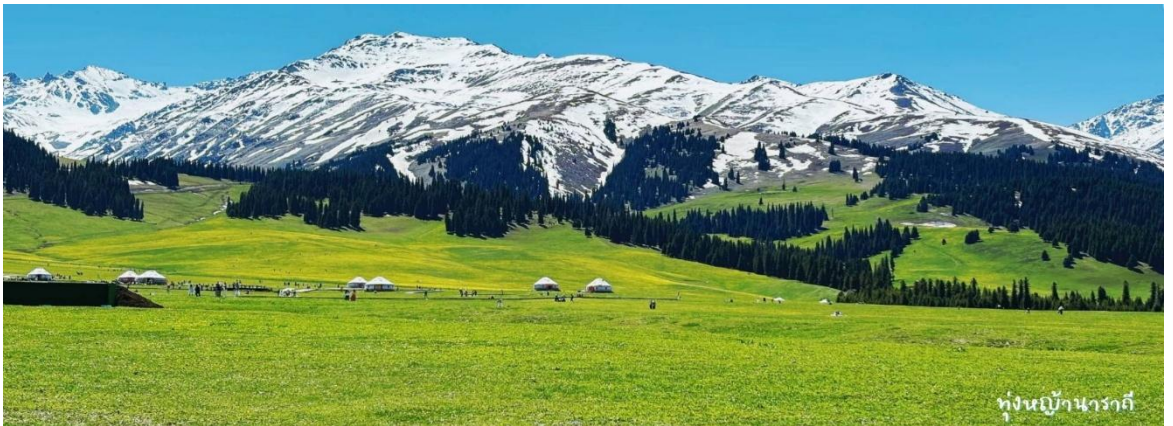
ทุ่งหญ้านาธาติ

นำท่านเดินทางสู่เมืองนาธาติ (ใช้เวลาเดินทางประมาณ 4 ชั่วโมง) ตั้งอยู่ในอำเภอซินหยวน เขตปกครองตนเองซินเจียงอุยกูร์ ประเทศจีน เป็นหนึ่งในทุ่งหญ้าสูงที่มีความสวยงามและมีชื่อเสียงที่สุดในประเทศ รวมถึงมีทัศนียภาพที่สวยงามจนได้รับการจัดอันดับเป็นจุดชมวิวระดับ 5 A ของประเทศจีน พื้นที่ของทุ่งหญ้าประกอบด้วยพื้นที่ของชนพื้นเมืองเผ่า คาซัค, พื้นที่พักสำหรับนักท่องเที่ยว และพื้นที่ทุ่งหญ้าซึ่งมีความอุดมสมบูรณ์ บนเขตที่ราบสูงที่ใหญ่เป็นอันดับ 2 ของจีน (Narat Grassland)